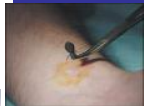
Use pinzas para remover la garrapata apropiadamente.

DIARIAMENTE EXAMINESE A VER SI TIENE GARRAPATAS!