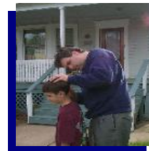
Asegurese de registrar los niños.

Para mas informacion contacte: La Division de Salud Publica de Atlantic County al 645-5935.